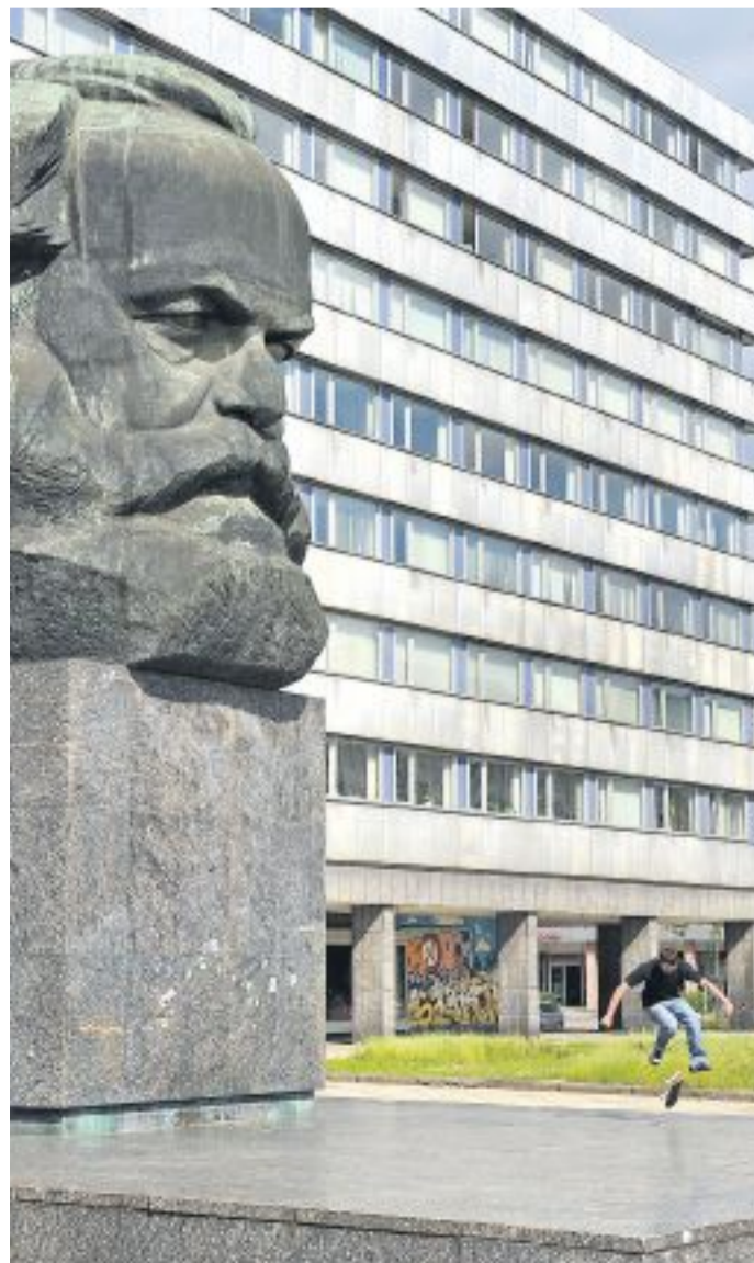
Chemnitzer Jugendlicher skatet vor der Marx-Büste.