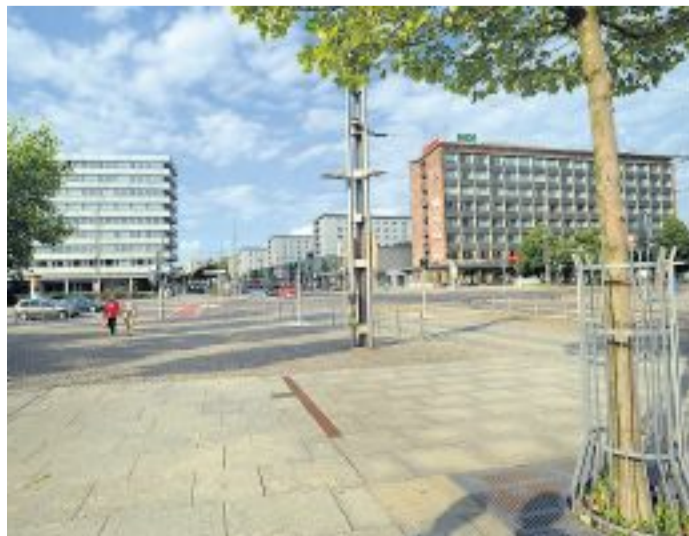
Aus Karl-Marx-Stadt wurde Chemnitz.