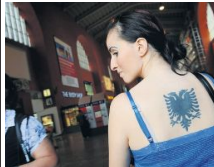
Deutscher Pass, aber albanischen Adler auf dem Rücken.