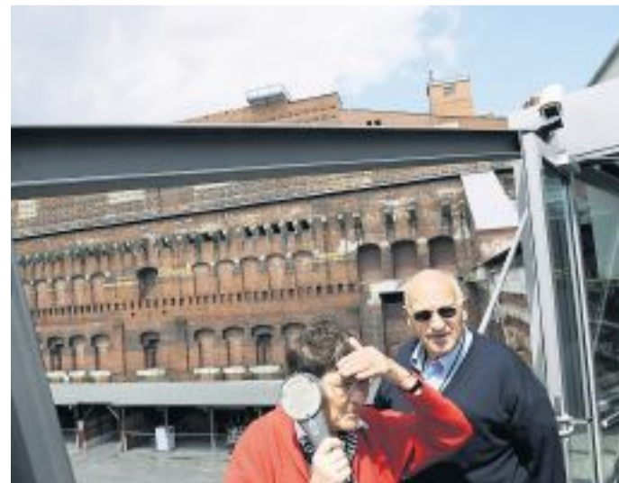
Besucher der Gedenkstätte NS-Reichsparteitagsgelände.