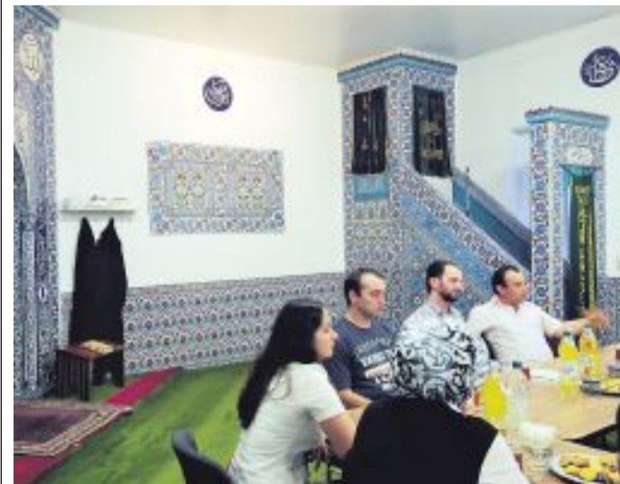
In einer Stuttgarter Moschee: Reden über Integration.