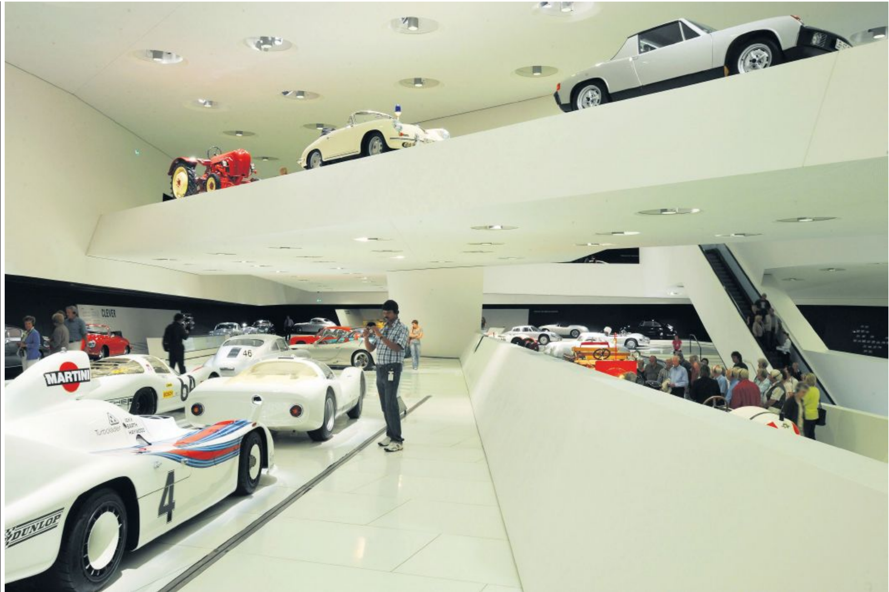
Im Museum in Stuttgart-Zuffenhausen: Hier hat Porsche der deutschen Autobebgeisterung ein Denkmal gesetzt.

Dass sich die Situation ohne solches Engagement rasch verschlechtern könnte, sieht man in Chemnitz sofort. Die Stadt wirkt, als käme sie mit dem Tempo der Welt nicht mehr mit. Ein Drittel seiner Einwohner hat Chemnitz seit 1989 verloren. Heute sind es noch 240 000. Die Folgen sind unübersehbar: Die breiten Einfallstrassen liegen abends verwaist da, der Brühl – einst die belebte Haupteinkaufsstrasse – lebt nur noch matt an beiden Strassenden. Dazwischen gähnen tote Fenster, klagen verrammelte Geschäfte von gescheiterten Träumen. Wie Pusteln finden sich über die ganze Stadt verteilt zerfallende Fabriken. Nachts um drei weckt mich Gegröle. Vielstimmig tönt es vor dem Hotel: «Deutschland! Ausländer – Ausländer – RAUS!»